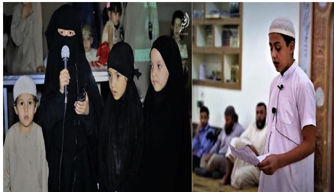
À gauche : une jeune fille récitant des chants louant Daech; À droite : un jeune garçon prêchant dans une mosquée locale.

discours et entonnent des chants faisant l'éloge des idées et des pratiques de Daech. 22 Daech table sur l'impact émotionnel que génèrent les enfants; c'est pour cela qu'il utilise ses enfants les plus charismatiques et les plus doués comme prédicateurs et recruteurs. 23 En outre, ces porte-paroles servent d'exemples pour recruter des hommes plus âgés en suscitant en eux un sentiment de culpabilité. L'idée est de mettre en relief le courage et l'audace de ces enfants pour faire valoir que si les jeunes enfants peuvent généreusement et courageusement consacrer leur vie à la cause d'Allah, les adultes n'ont aucune raison d'avoir peur.