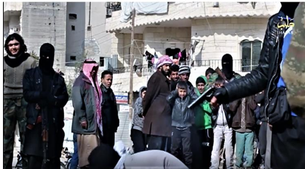
De jeunes garçons couvrent leurs oreilles et sont visiblement traumatisés et effrayés, car ils sont obligés d'assister à une exécution publique

Daech emploie également des méthodes de recrutement plus directes, en s'appuyant notamment sur les liens familiaux et communautaires. Pour recruter des combattants, Daech offre aux familles de l'argent en espèces pouvant s'élever jusqu'à 100 $ par mois. 10 Daech exerce également son influence par l'intermédiaire de prédicateurs et d'imams afin de conditionner les parents à inscrire volontairement leurs enfants dans ses camps d'entraînement. Bien que l'éducation, l'endoctrinement et la mobilisation sociale fassent partie intégrante de la stratégie de Daech pour recruter des enfants et les maintenir au sein de l'organisation, des mesures coercitives sont prises sans scrupule pour élargir son armée. Les actions coercitives explicites incluent des enlèvements et des menaces de mort contre les enfants et leurs familles, 11 alors que la coercition implicite prend la forme de pression sociétale et se traduit par la peur d'être qualifié de traître ou d'apostat si l'on refuse d'adhérer à la mission de l'organisation.