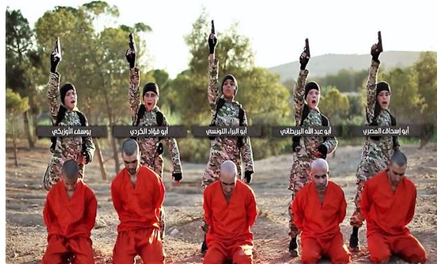
Des enfants militants exécutant des ennemis de Daech

Participants à la violence : le recrutement d'enfants par des groupes armés en temps de guerre n'est pas un nouveau phénomène. Cependant, l'exploitation d'enfants ne servait traditionnellement qu'à accomplir d'autres missions de guerre ou à remplir les rangs des militants adultes. 24 Quant à Daech, il déploie régulièrement des enfants en tant qu'acteurs principaux aux côtés de leurs homologues adultes pour mener de très violentes opérations. Dans ses médias de propagande, Daech représente fièrement ses enfants comme des tireurs, des bourreaux, des kamikazes et des soldats en action sur les champs de bataille. 25 Les enfants sont également formés comme jeunes officiers chargés de punir et de torturer des prisonniers et des dissidents du « califat ».